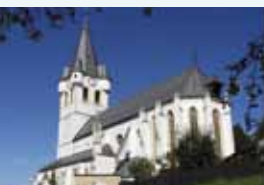
Bad St. Leonhard

Schon Paracelsus verwies auf die heilende Wirkung des Schwefelbades in der Stadt Bad St. Leonhard. Ein modernes Gesundheitszentrum, exzellente Gastronomie und ein facettenreiches Kulturleben sind besonderer Ausdruck der Lebensqualität im oberen Lavanttal.